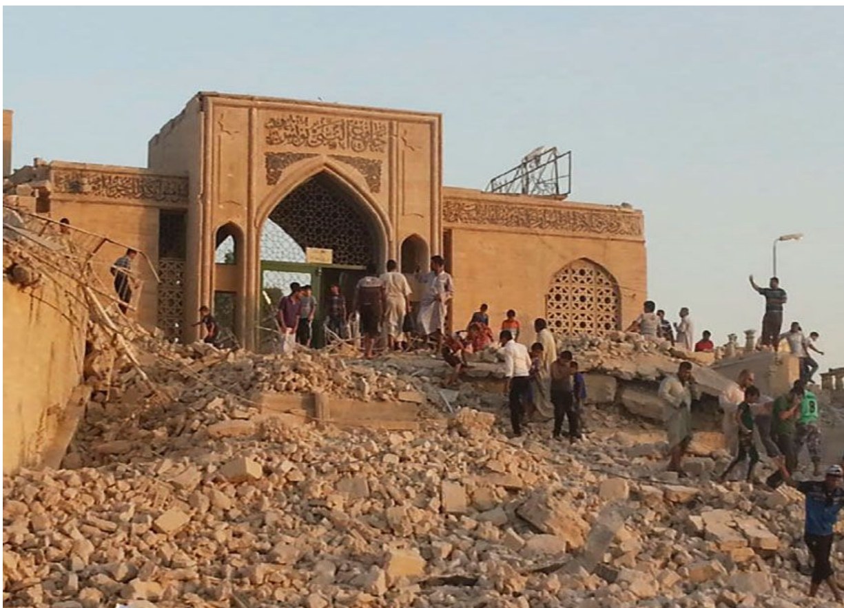
Взорвана боевиками ИГИЛ.