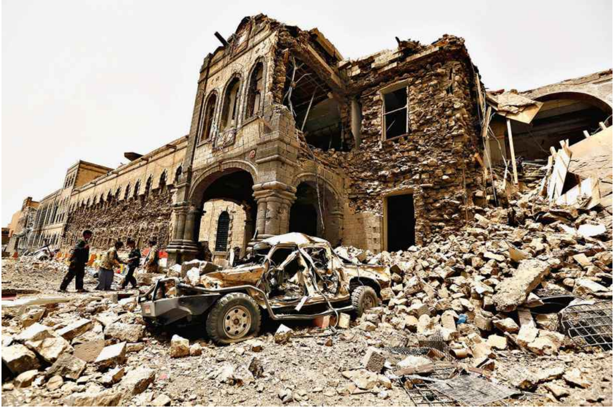
Последствия бомбардировок.