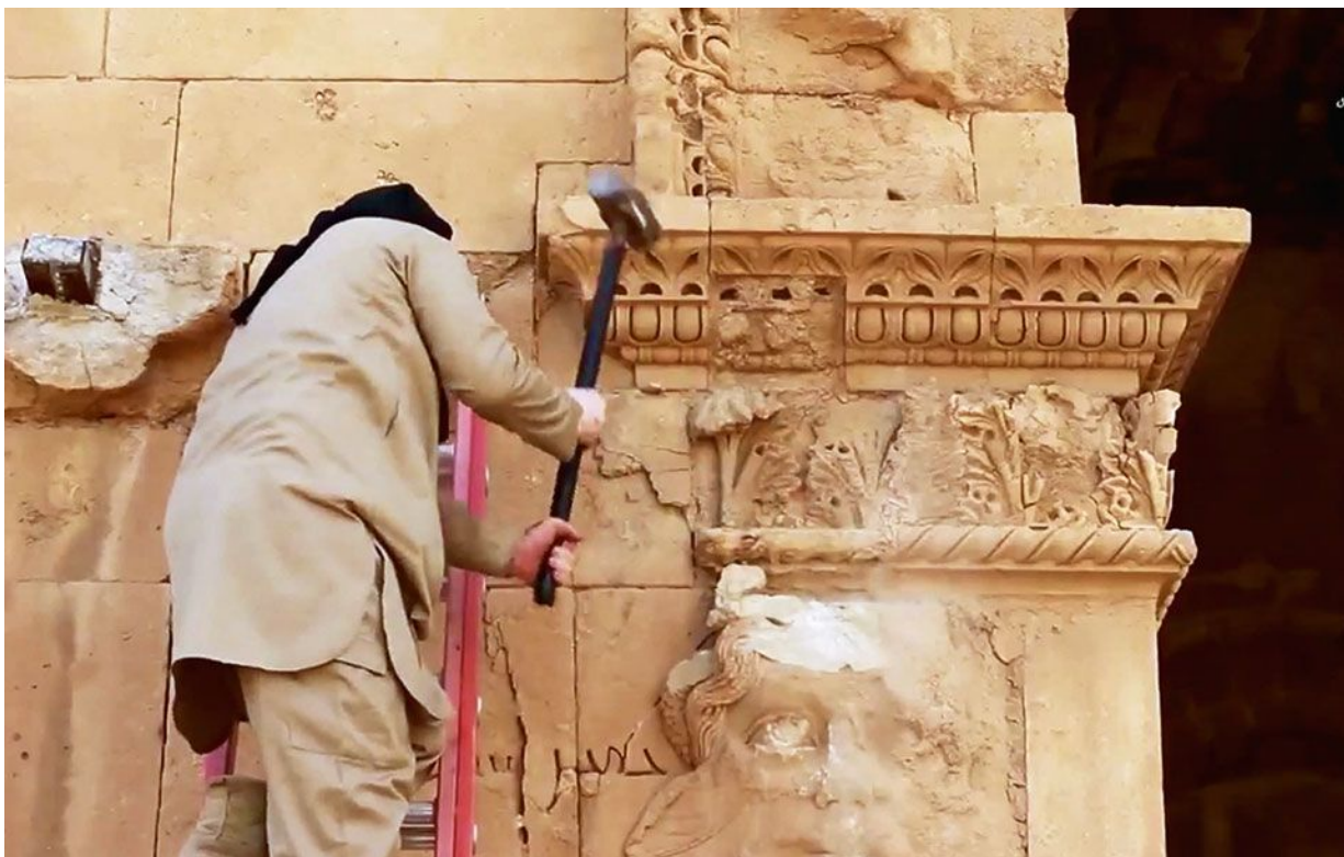
Боевик ИГИЛ, разрушающий строения Хатры.

Хатра – древний город на территории современного Ирака (объект Всемирного наследия ЮНЕСКО). III в. до н. э.