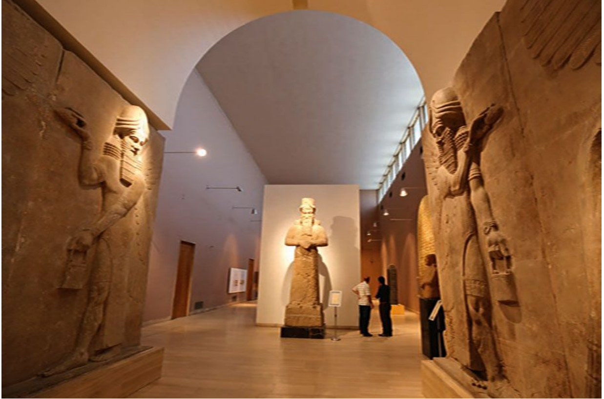
Национальный музей в Багдаде. Ирак.