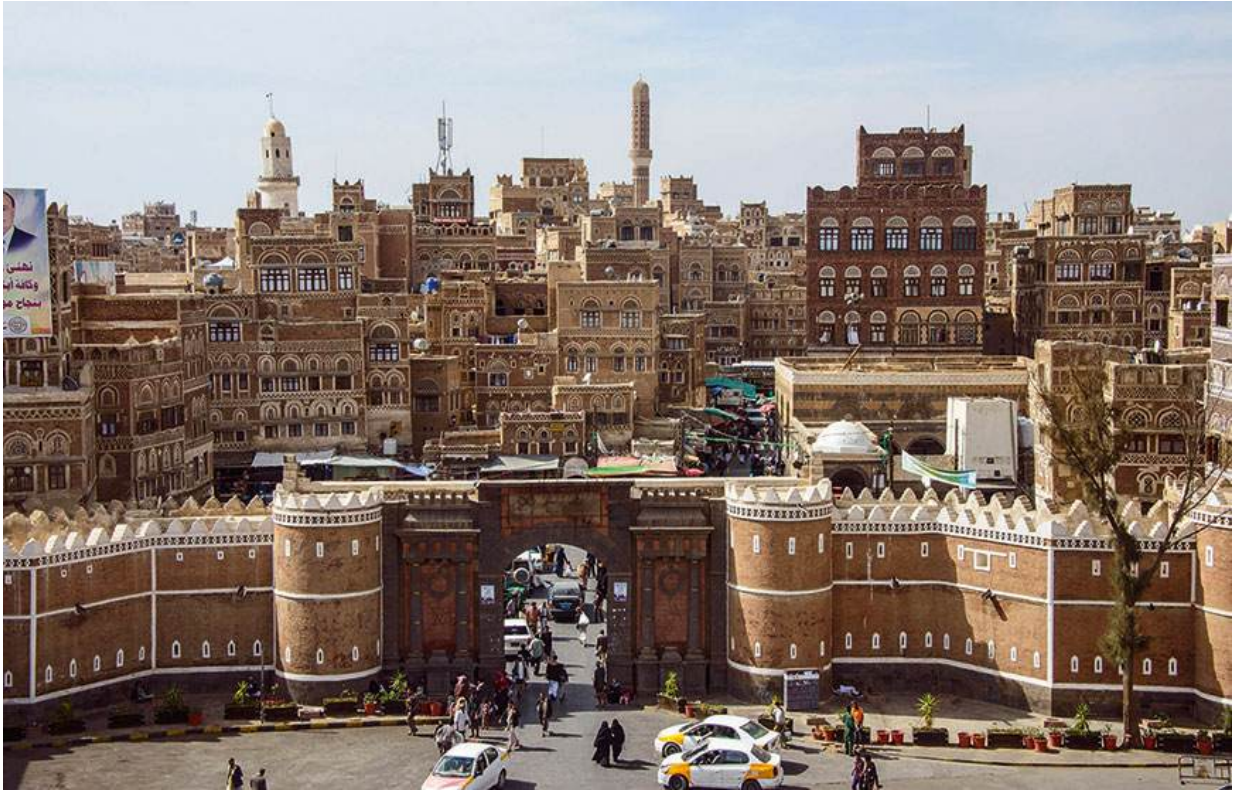
Старый город в Санае (объект Всемирного наследия ЮНЕСКО). Йемен.