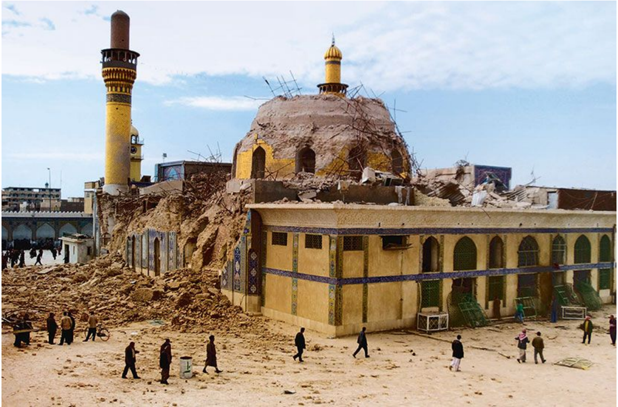
Последствия двух терактов в 2006 и 2007 гг.