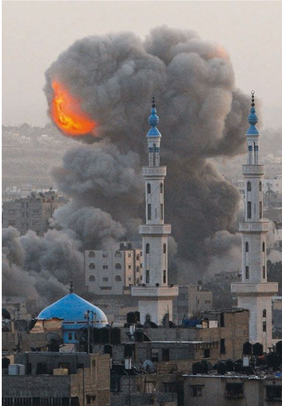
Бомбардировка Израилем сектора Газа. Палестина.