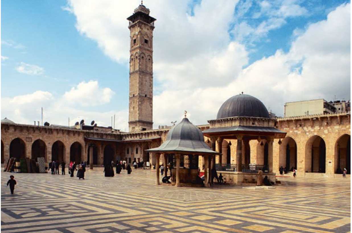
Мечеть Омейядов. VIII в. Алеппо. Сирия.