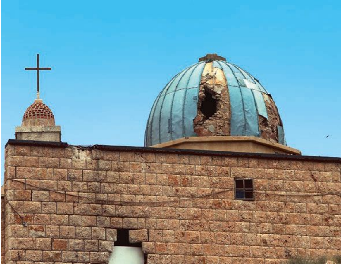
Последствия обстрела.