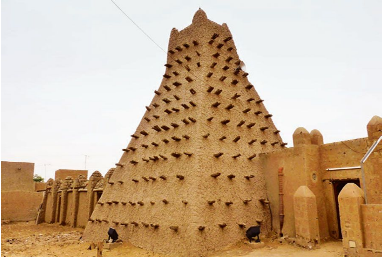
Мавзолей Тимбукту (объект Всемирного наследия ЮНЕСКО). Мали.