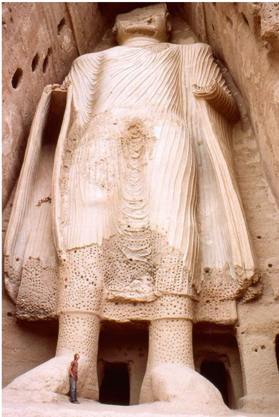
Статуя Будды в провинции Бамиан. Афганистан. IV–III вв. до н. э.