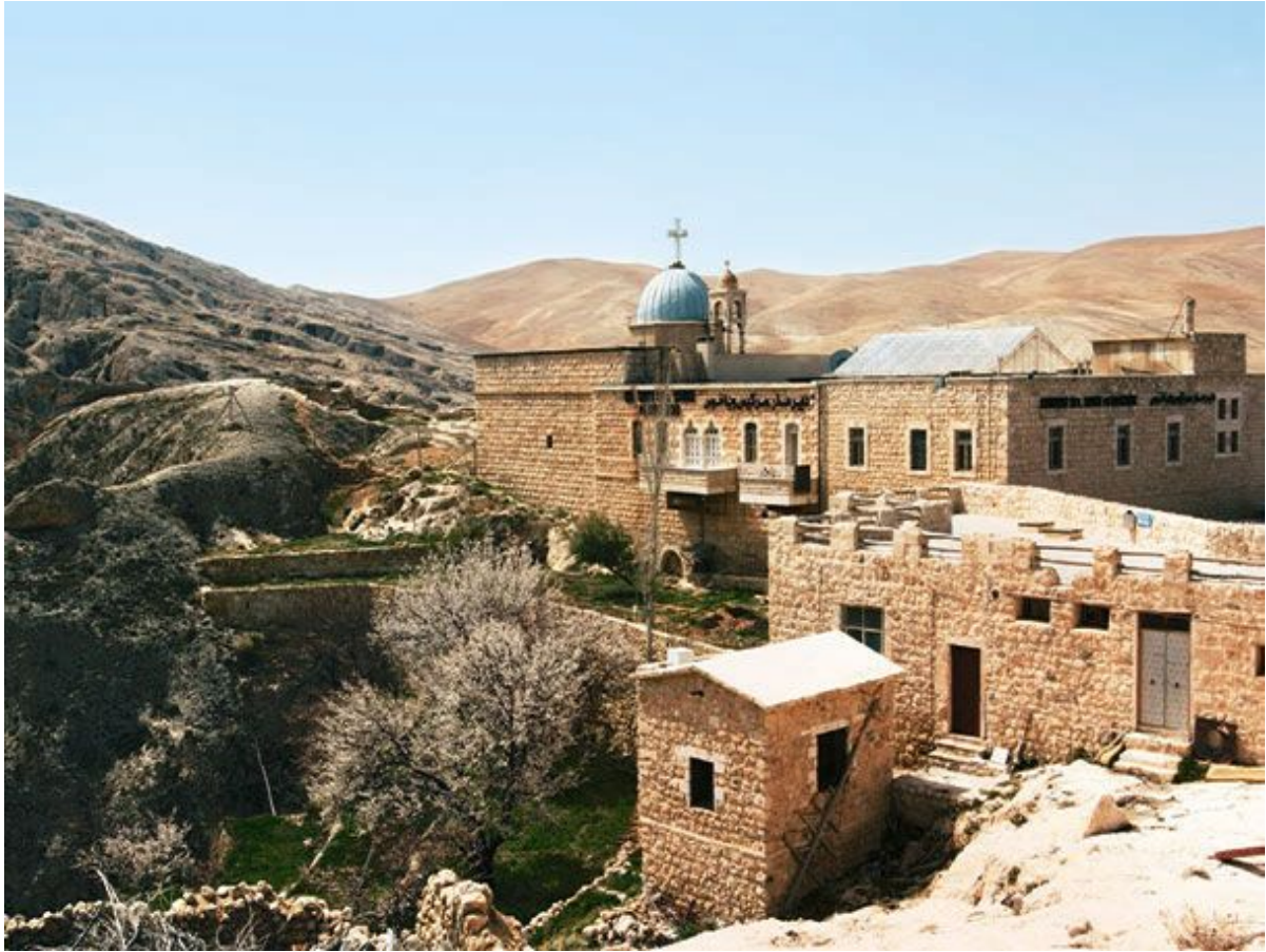
Монастырь Св. Сергия и Вакха. IV в. Сирия.