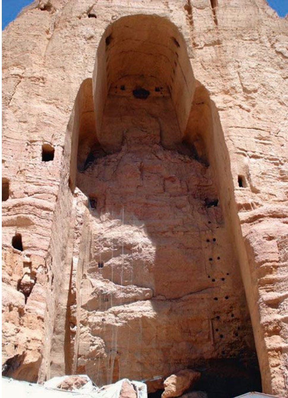
Уничтожена сторонниками движения Талибан.