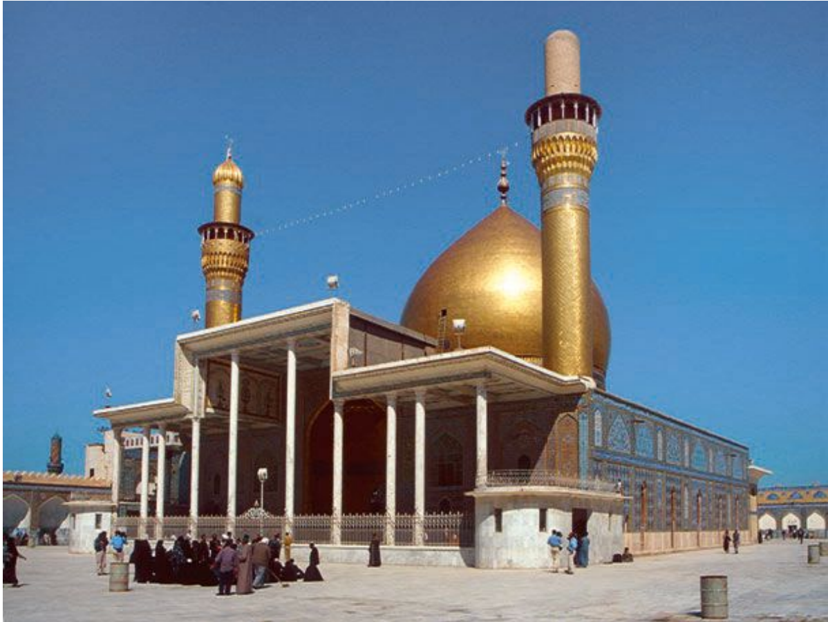
Мечеть Аль-Аскари (Золотая мечеть). 944 г. Самарра. Ирак.