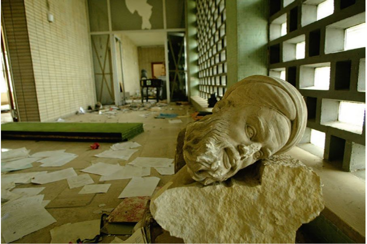
Разрушен в результате военных действий.