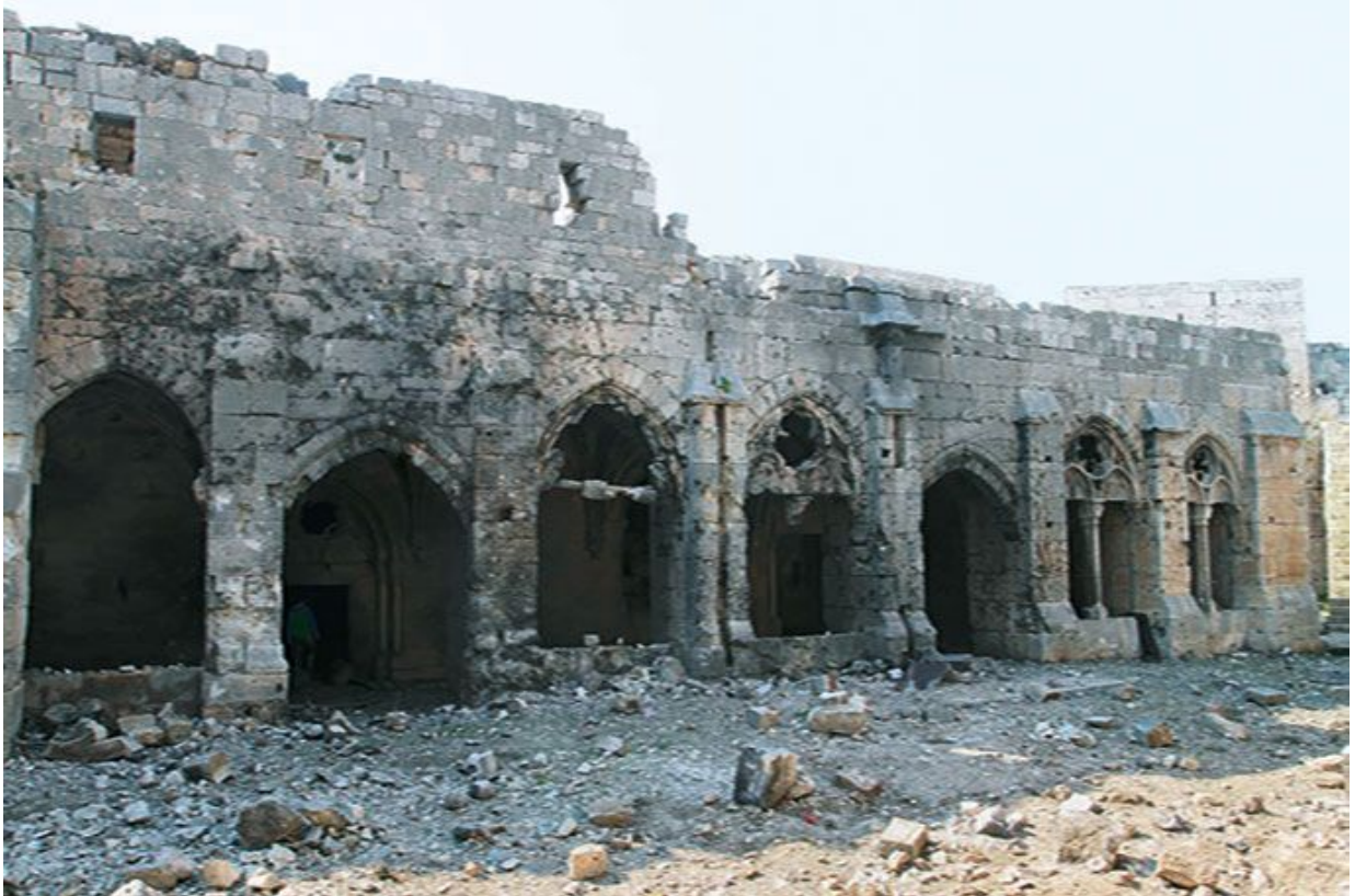
Пострадал во время боевых действий.