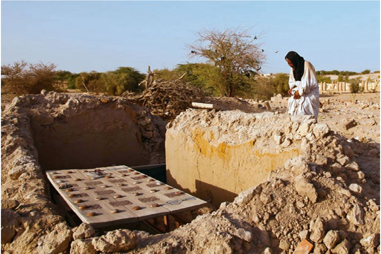
Остатки мавзолея, уничтоженного боевиками-исламистами.