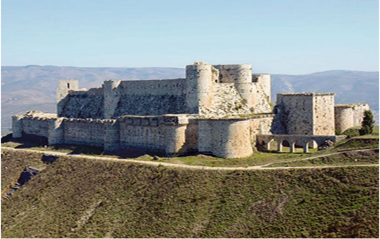
Замок Крак де Шевалье (объект Всемирного наследия ЮНЕСКО). XI в. Сирия.