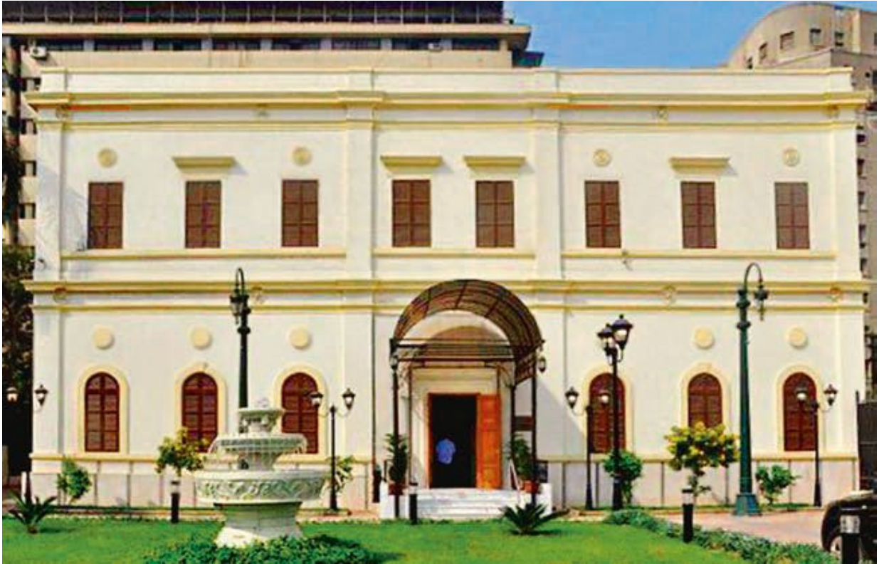
Институт египтологии в Каире. Египет.