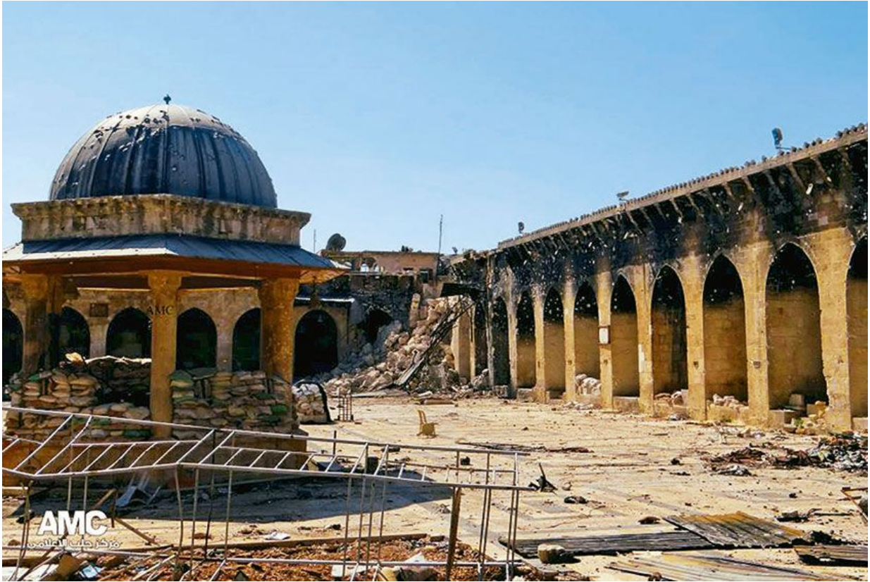
После военных действий.