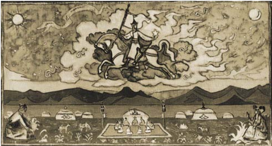
Н.К.Рерих. Красный всадник. 1926