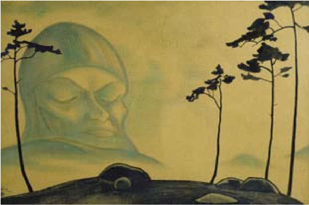
Н.К. Рерих. Сон Востока. 1920. Частная коллекция, США