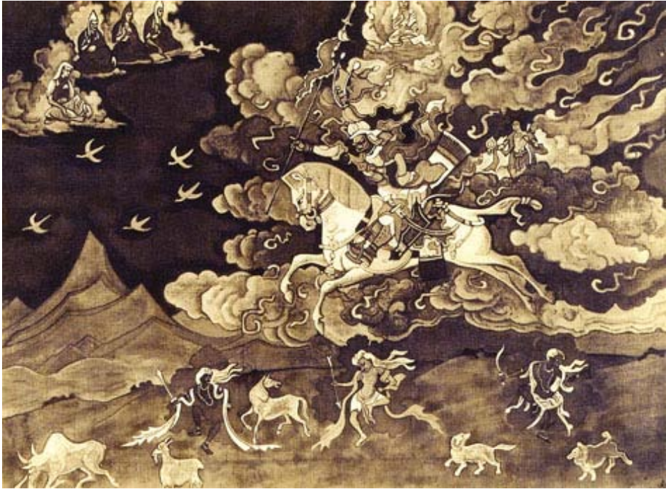
Н.К.Рерих. Шамбала идет. 1926