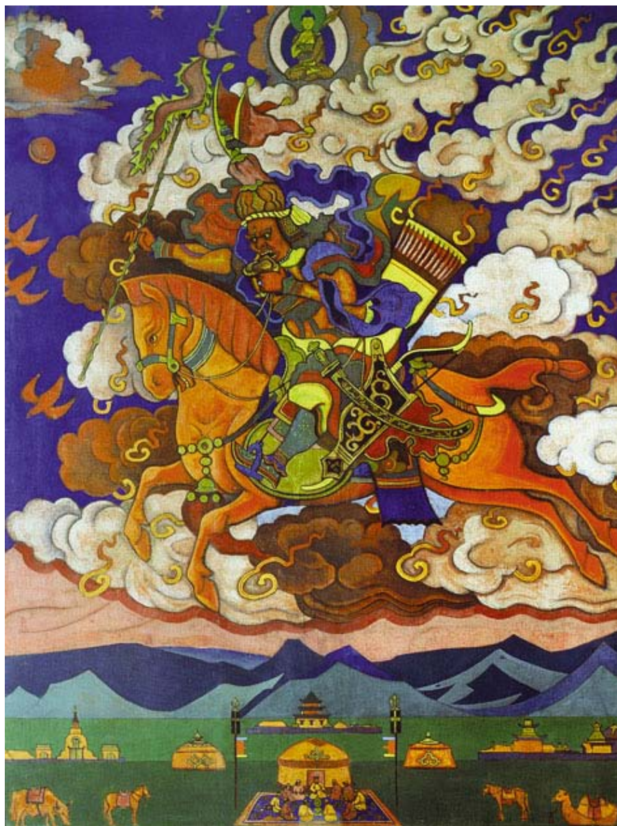
Н.К.Рерих. Великий Всадник. 1927. Музей изобразительных искусств. Улан-Батор, Монголия