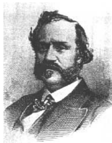
Джон Эрнст Уоррел Кили

Изобретатель рассказал сотрудникам Scientific Arena о самом начале своей творческой жизни. Джон Эрнст Уоррел Кили родился в г.Филадельфия 3 сентября 1827 г. Он потерял родителей в раннем детстве и уже с трёхлетнего возраста воспитывался бабушкой и тётёй. В шестнадцать лет Д.Кили остался круглым сиротой и был предоставлен собственным силам в борьбе за существование. Ещё в отрочестве он увлёкся исследованием звука как силы. Толчком к этому послужило наблюдение, что при некоторых звуках органа дрожали стёкла окон. Исследовать звук Д.Кили начал в десять лет, а своё первое открытие сделал, когда ему было тринадцать.